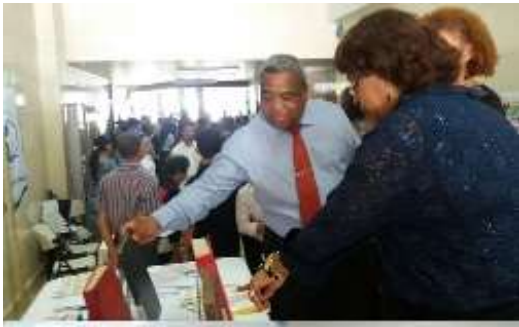
En el marco de la celebración del 80 aniversario de fundación de la Universidad de Panamá, el Sistema de Bibliotecas de la Universidad de Panamá (SIBIUP), participó con un stand, en donde se exhibieron tesis de personajes destacados que transformaron sus vidas, entre ellos José Isabel Blandón, Alcalde del Distrito de Panamá, Ana Matilde Gómez, Diputada Independiente, Guillermo Endara, expresidente de la República de Panamá, por mencionar algunos. Además se dieron a conocer los diversos servicios que ofrece el Sistema de Bibliotecas y el nuevo horario de atención a usuarios los sábados. El stand estuvo muy concurrido por la comunidad universitaria. Asimismo, en la Biblioteca Interamericana Simón Bolívar se presentó la exposición de documentos representativos de la historia de la Universidad de Panamá. (7 de octubre).