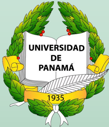
Universidad de Panamá