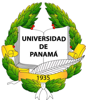
Universidad de Panamá