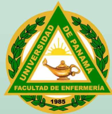
Facultad de Enfermería