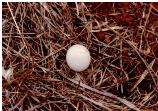
Fig. 4. Huevo de Columbina talpacoti encontrado en el suelo.