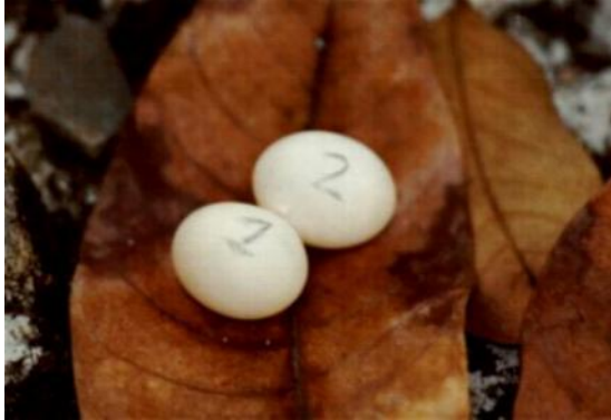
Fig. 2. Huevos marcados como parte de la metodología para determinar la duración de la incubación.