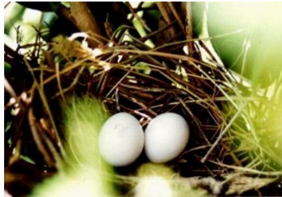
Fig. 3. Nido y camada normal de Columbina talpacoti con huevos ovalados.