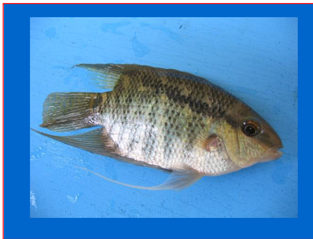
Fig. 1. Adulto de Mesonauta festivus colectado en La Lagarterita, Lago Gatún.

Conociendo la pluralidad de especies que integran el género Mesonauta , utilizamos la clave aparecida en la revisión sistemática de Kullander & Silfvergrip (1991), para determinar que la nueva especie exótica habitante del Lago Gatún, corresponde al pez ornamental conocido como festivo o cíclido bandera ( Mesonauta festivus , Fig. 1)